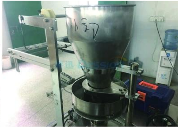
POWDER PUT IN EQUIPMENT