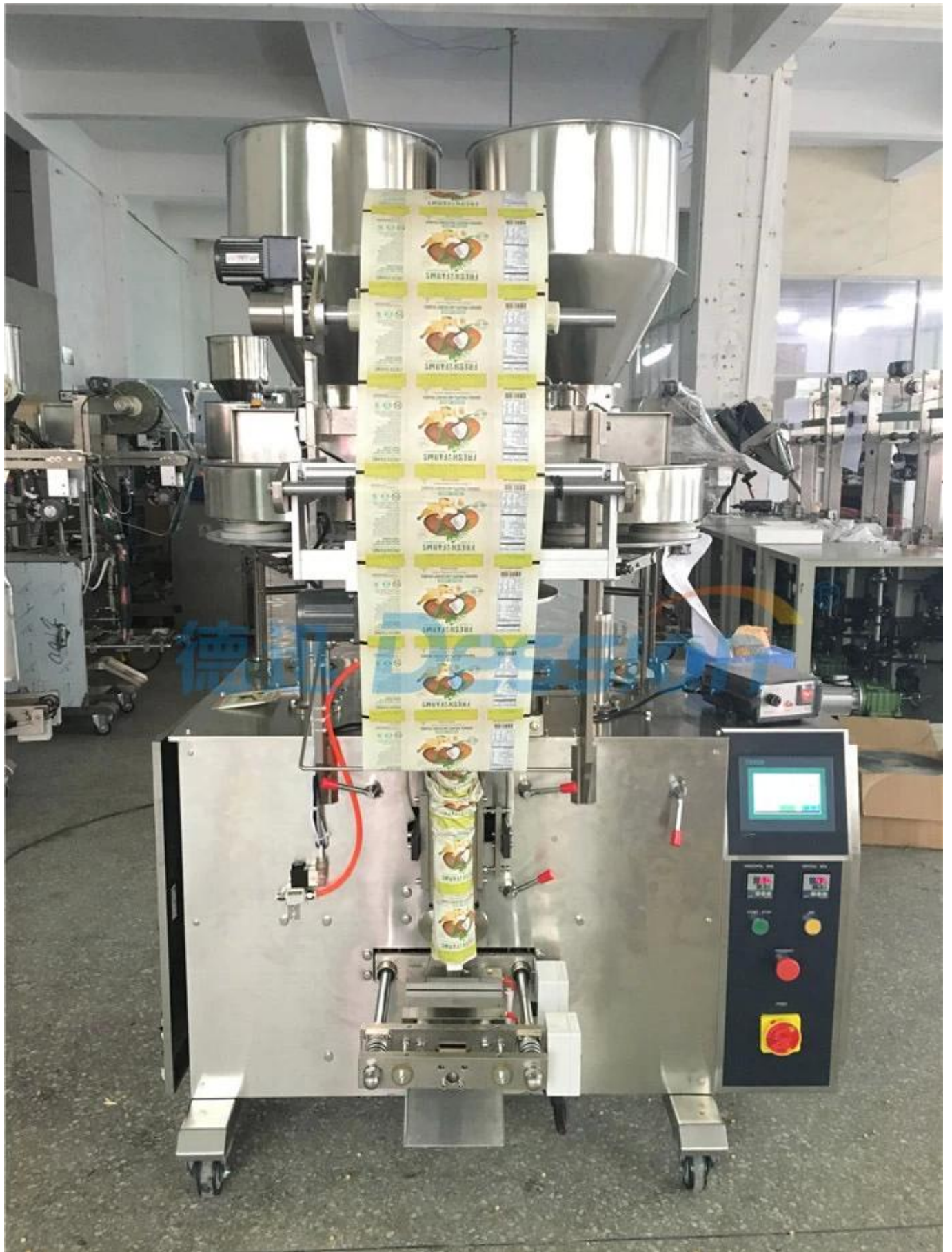
1. Vue de face