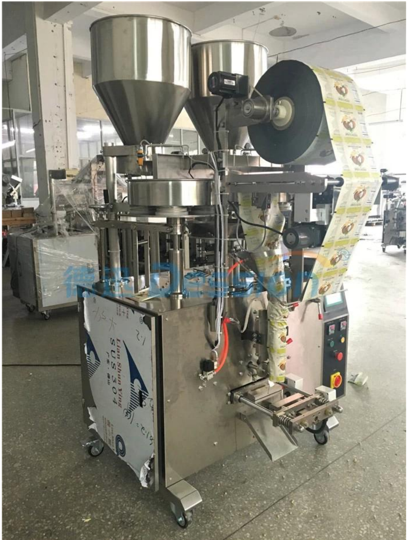
2. Vue latérale