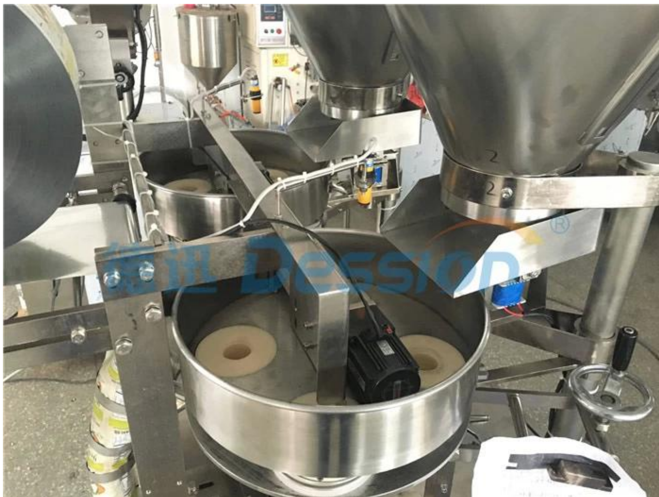
5.2 Mesure des tasses