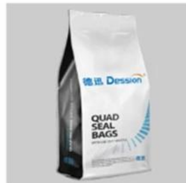
Quad Seal Bag