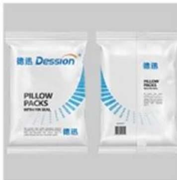
Back Seal Bag