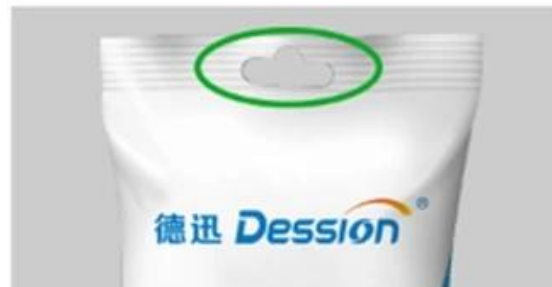
Bag With Hole