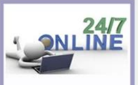
7-24 Hours services