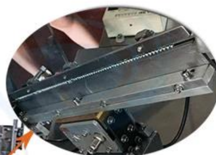
Precise Skid Trail