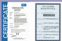
Tight quality control