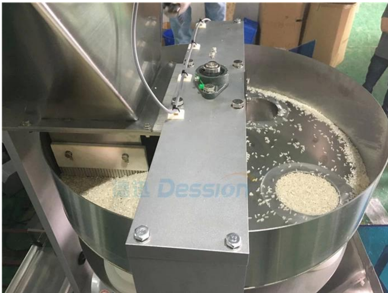
3. Dosage des tasses