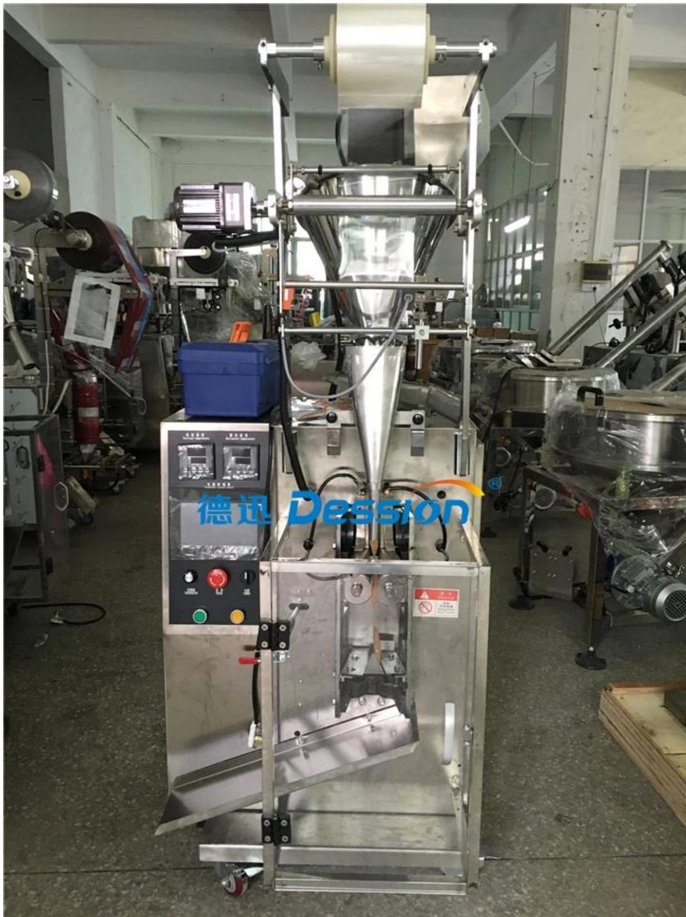
Faces avant S manger