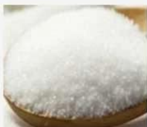
refined cane sugar