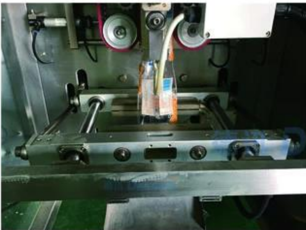
CUTTING AND SEALING PART