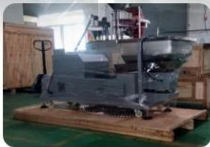
Wapping the Machine And Put into Wooden Case