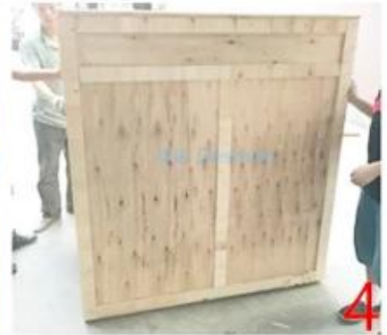
250X Perfume Card Horizontal Packaging Machine □□