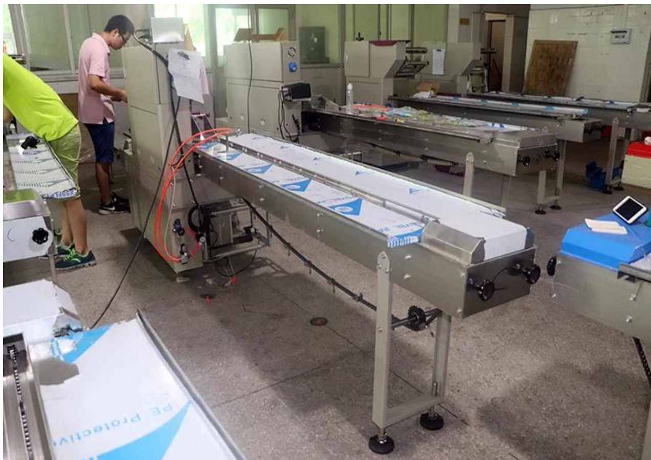
250X flow packaging