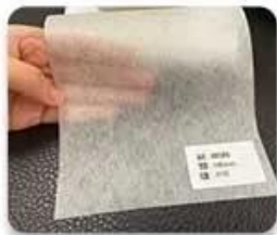
Ripple non-woven fabric