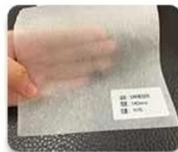
Corn fiber non-woven fabric