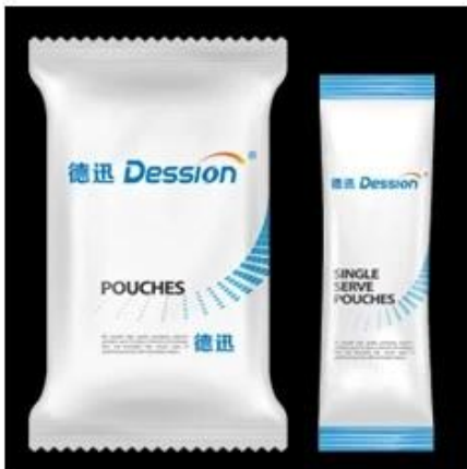
Back Sealing Bag