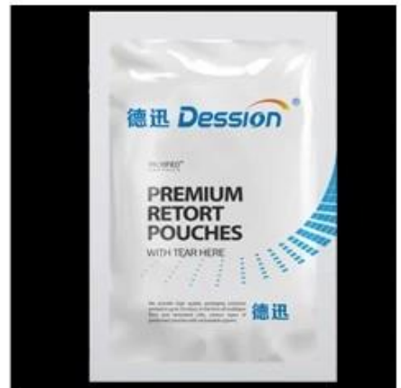
4-Sides Sealing Bag