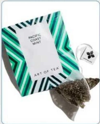
Tea Bag With Envelop