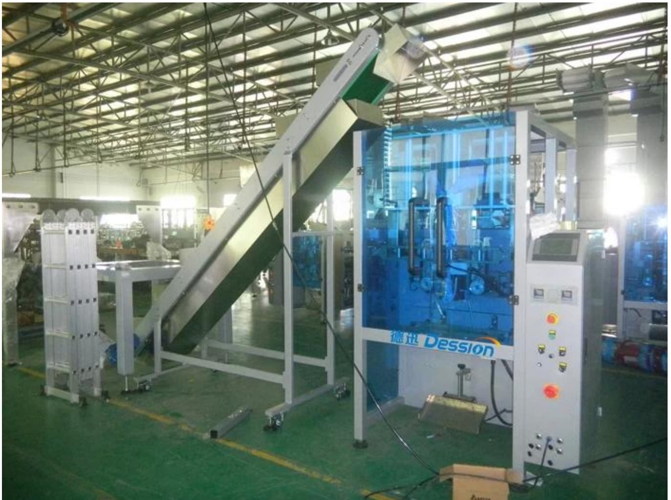
Het hoofd van de hele weergave ontbreekt de weging