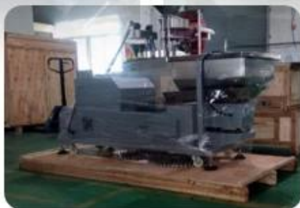
Wapping the Machine