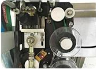
Ribbon Date Printer