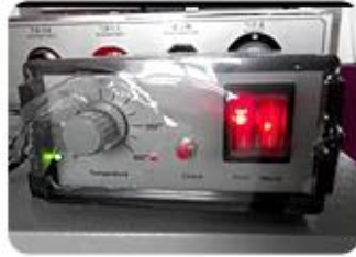
Encoder Heating Device