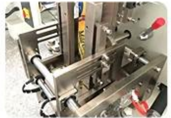
Four Side Sealing Mold