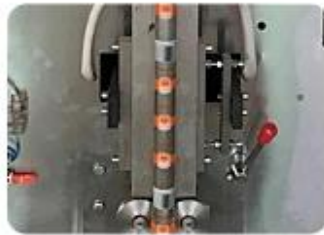
Back Sealing Mold