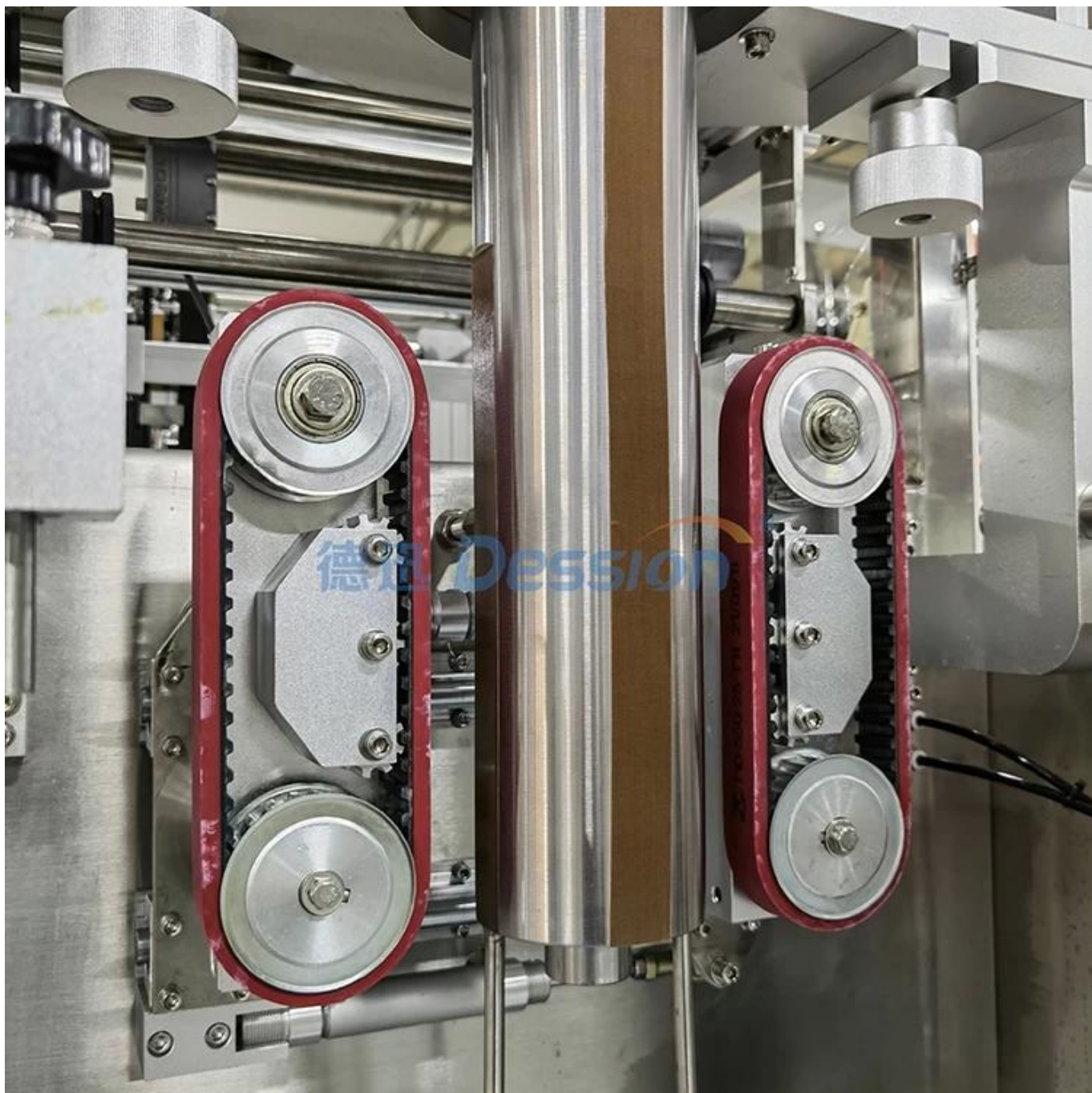
Afdichtingsdeel en zakmaker