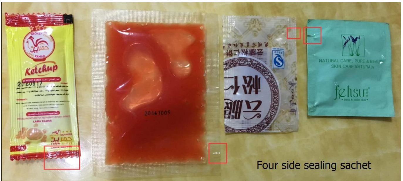
Four side sealing sachet