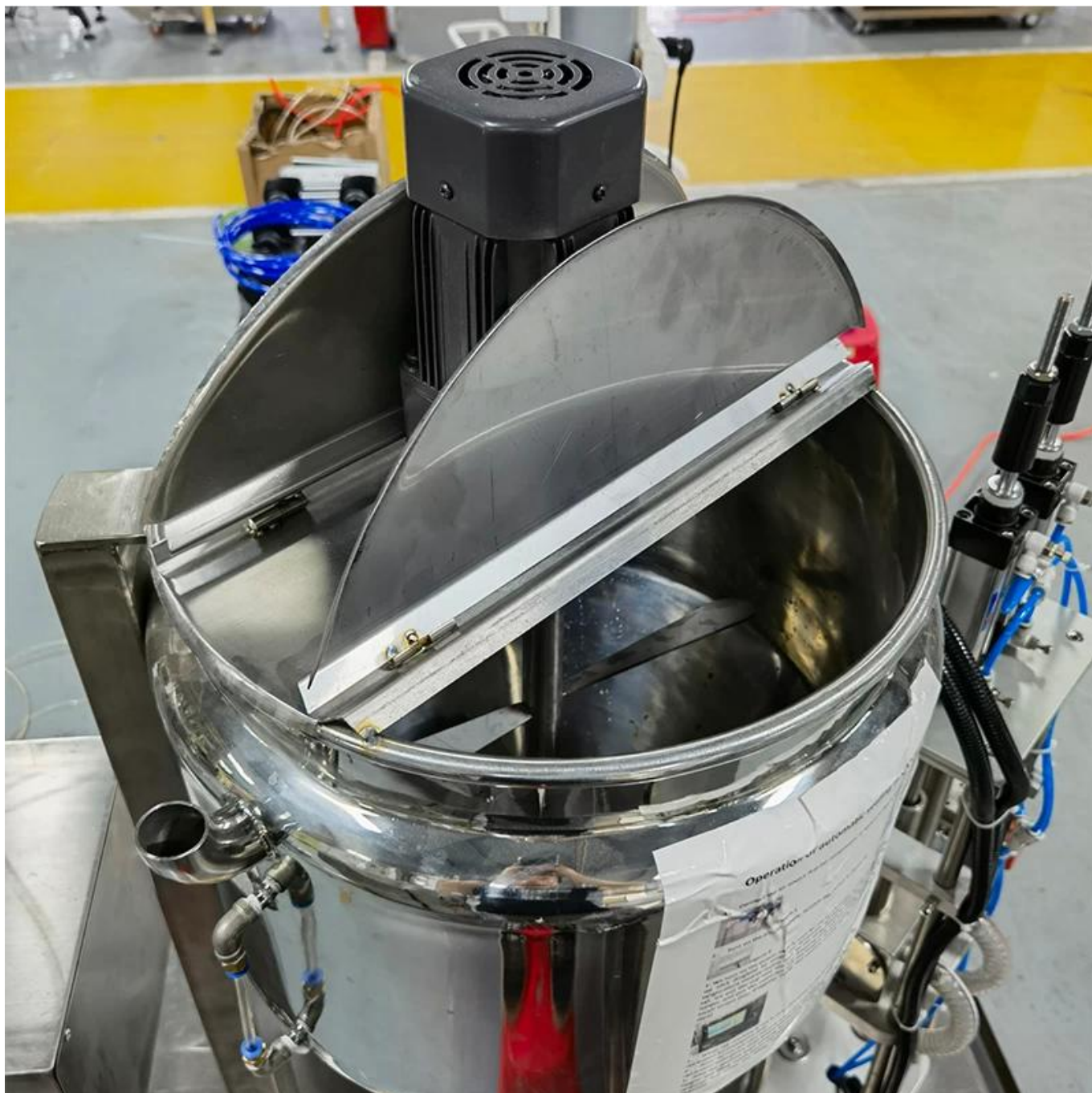
Roer en verwarm