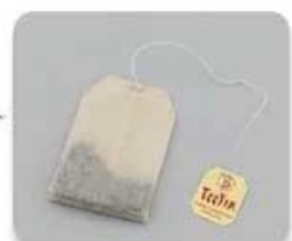
Corn fiber non-woven fabric