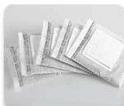
Ripple non-woven fabric