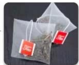
Corn fiber mesh