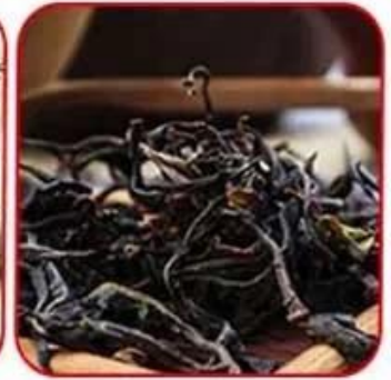
Ceylon black tea