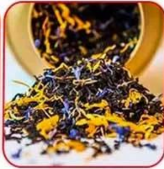
Earl Grey Tea