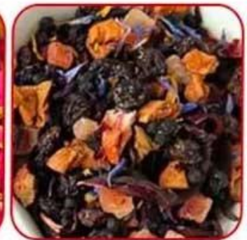
Particles of tea