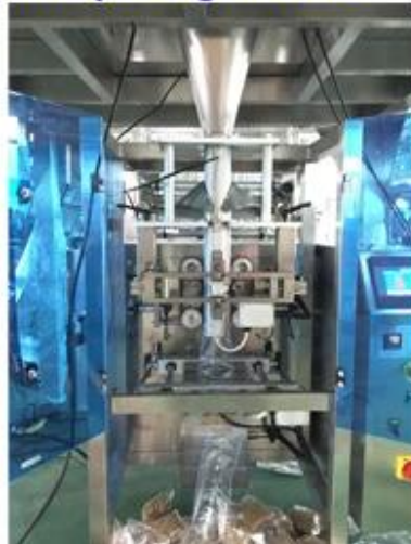
Nuts packing machine