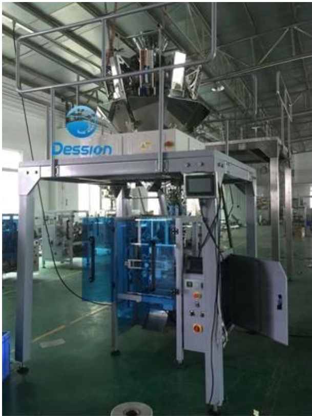
10 head Combination Scale