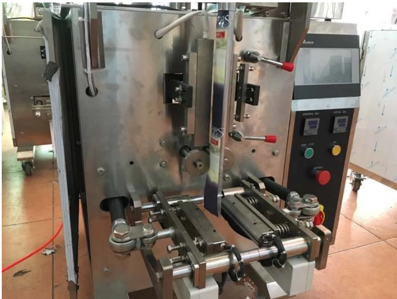
DATA PRINTER, AUTOMATISCH DE DATUM VAN PRO. EN EXP. DATUM OP DE ZAK.