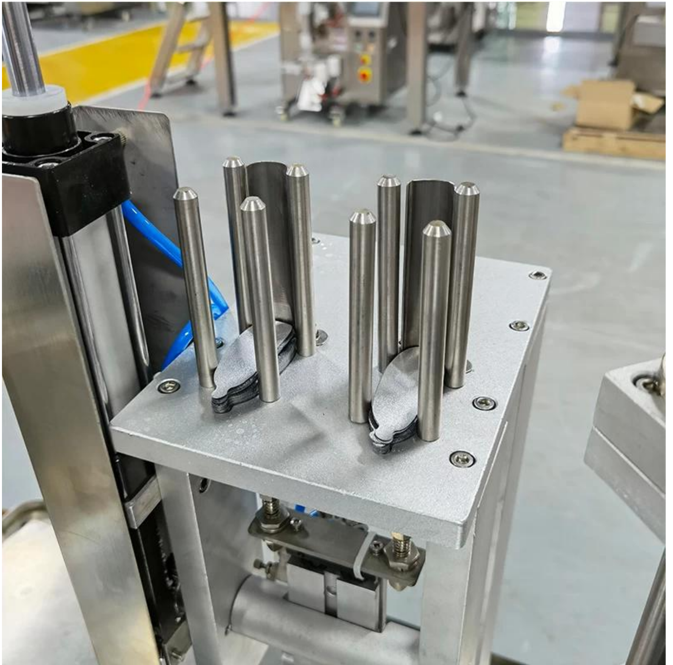
Apparaat voor het loslaten van films