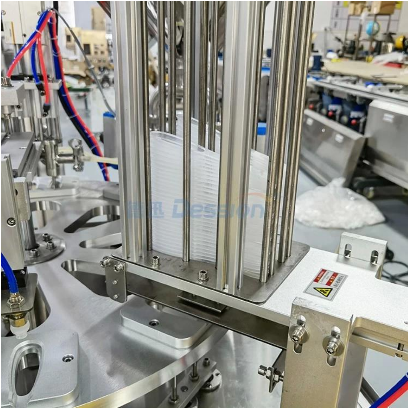
Apparaat voor het loslaten van de lepel