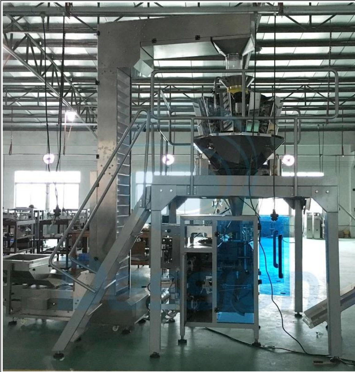
Pakket en verzending