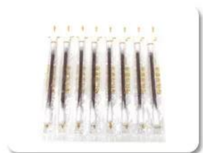
Sterile Cotton Swab