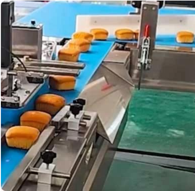
Afwijzingsapparaat Weiger automatisch niet- gekwalficeerde producten