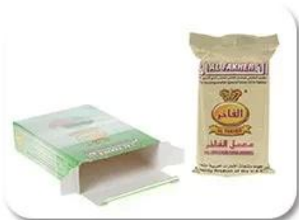
Bag Into Box