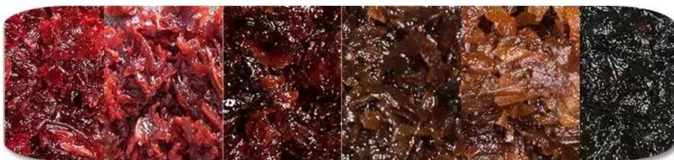
Shisha Tobacco Materail

Dession shisha-tabakverpakkingsmachine een toepasbaar voor iets stok zoals shisha, tabak, waterpijp enzovoort.