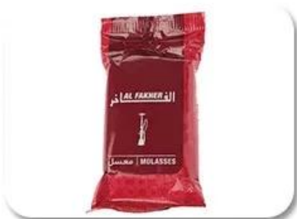
Plastic Bag Packing