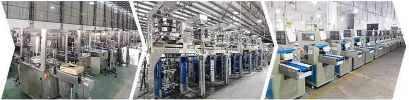
FILLING MACHINE WORKSHOP