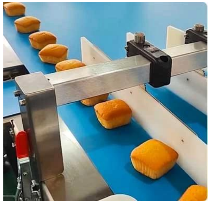
Transporteenheid Transportband heeft de functie van materiaaltransport, organiseren, ordenen en begeleiden