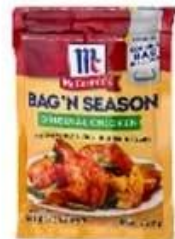
3/4 side seal bag