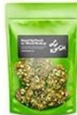
Stand up pouch bag