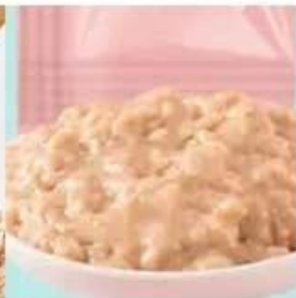
Pet meat paste