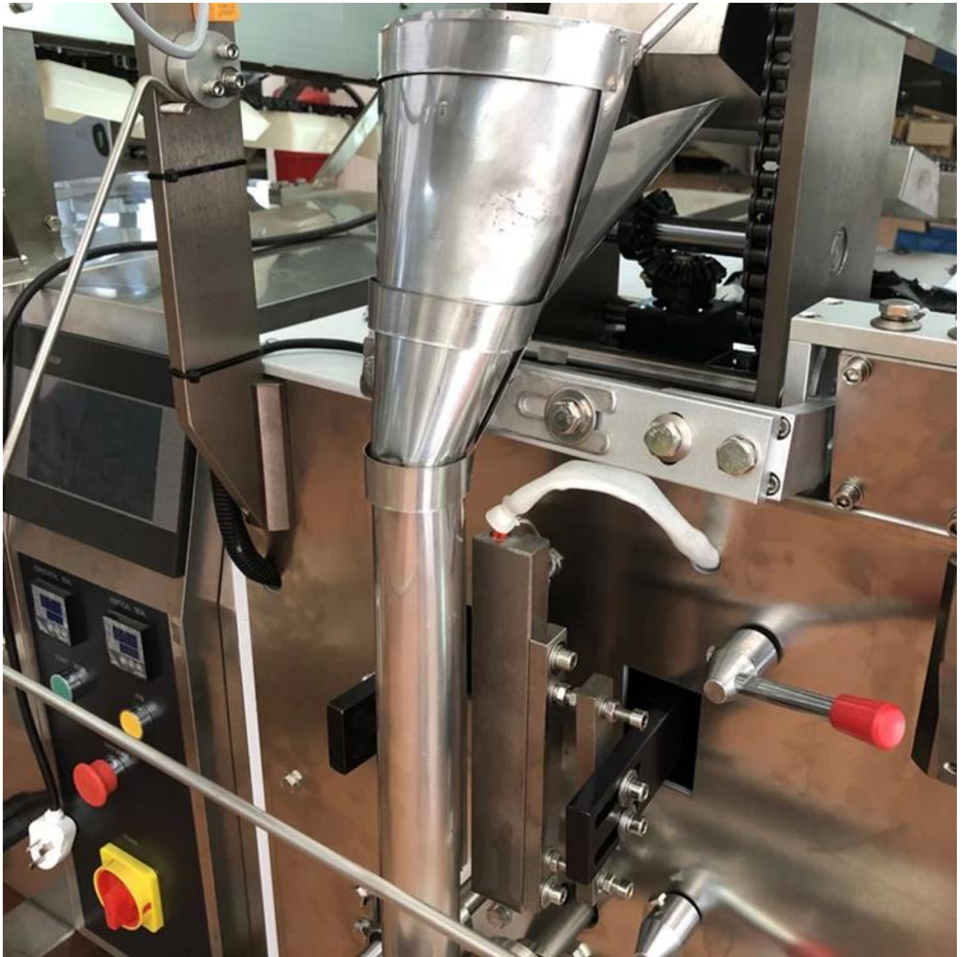
6) Afdichting bar zegel de tas