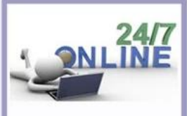
7-24 Hours services