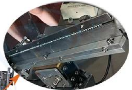
Precise Skid Trail