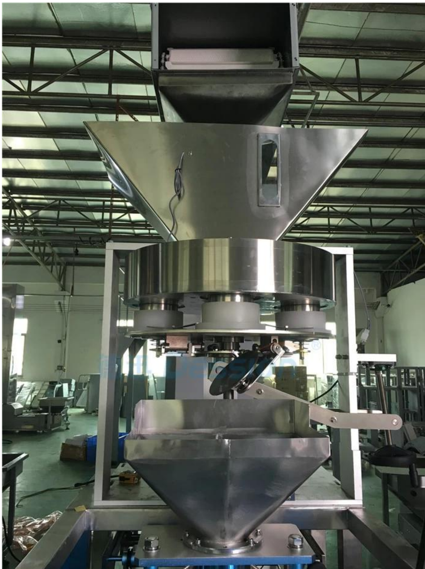
2. Het verpakte artikel gaat in de beker voor dosering