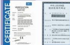
Tight quality control