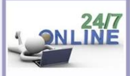
7-24 Hours services