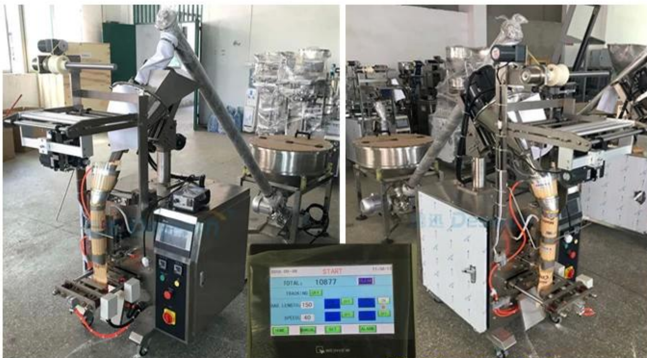
Big Touchable Screen

super ontroerend scherm, aangepaste 50L/70L voorraadtrechter, schroef meetapparatuur