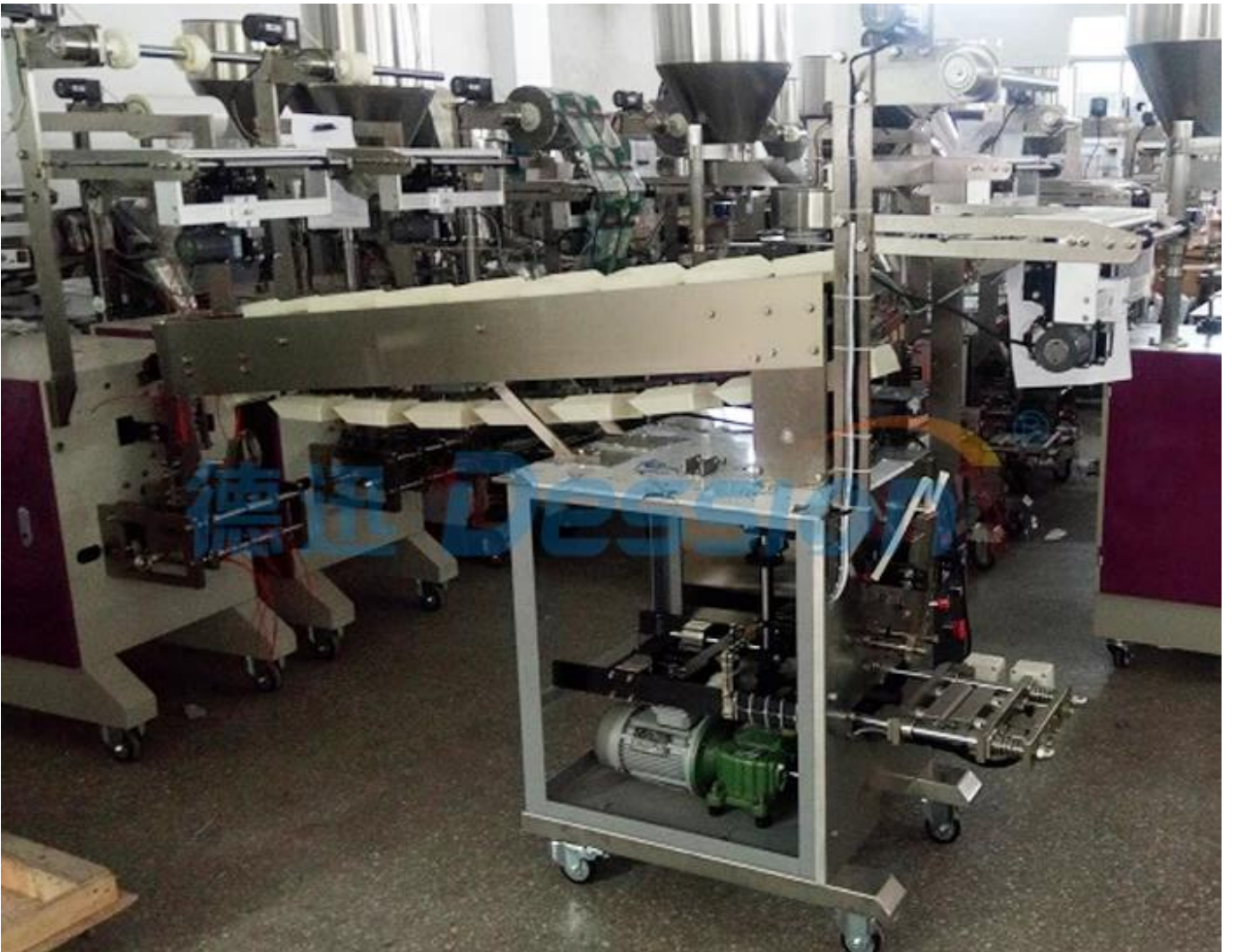
Automática bolsa de té máquina de envasadora y selladora