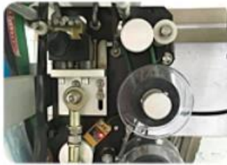
Ribbon Date Printer