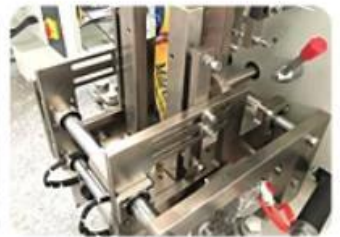
Four Side Sealing Mold