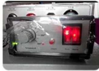
Encoder Heating Device