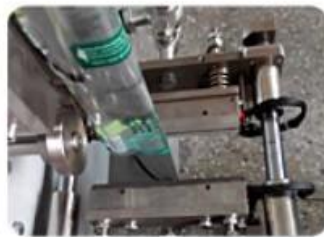
Three Side Sealing Mold