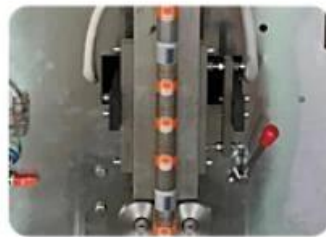
Back Sealing Mold