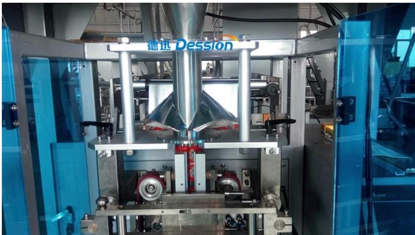
Formação de saco