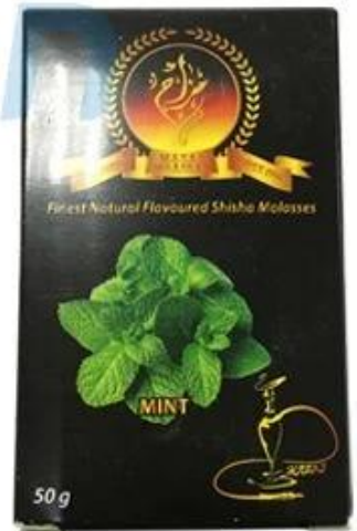
Tobacco back seal inside and outside packaging

Apresentando os acessórios elétricos Dession E a & Manutenção gratuita vitalícia