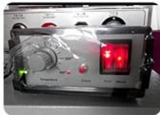
Encoder Heating Device