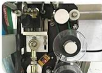
Ribbon Date Printer