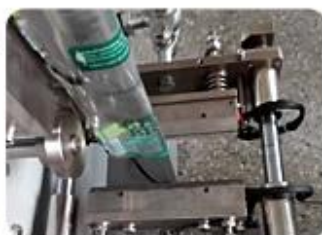
Three Side Sealing Mold