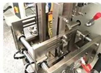
Four Side Sealing Mold