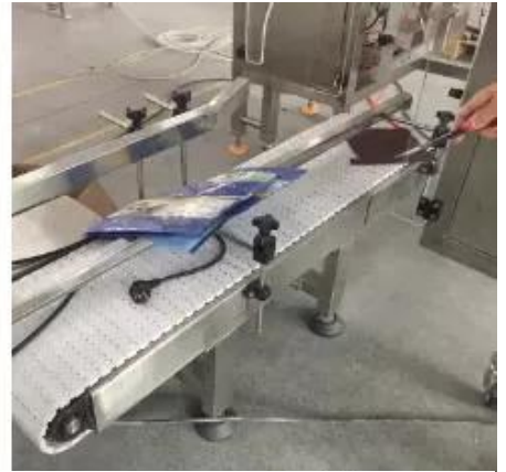
Transportador de produtos acabados