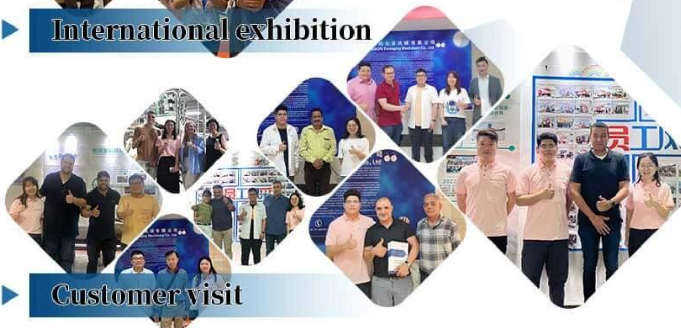
▶ Customer visit