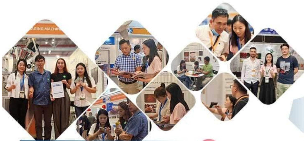
▶ International exhibition