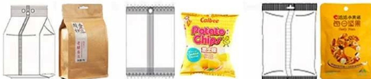
Bag with hole punching