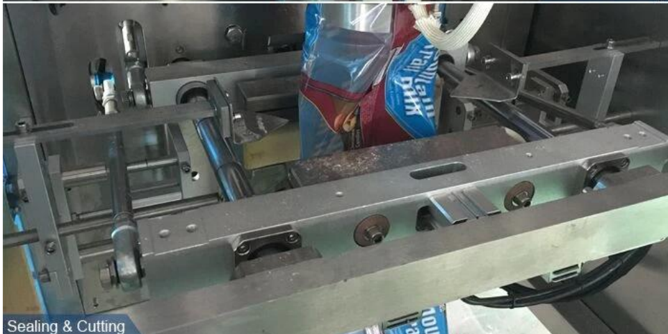
Sealing & Cutting