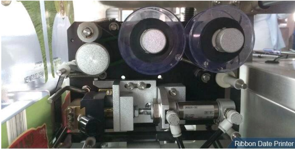
Ribbon Date Printer