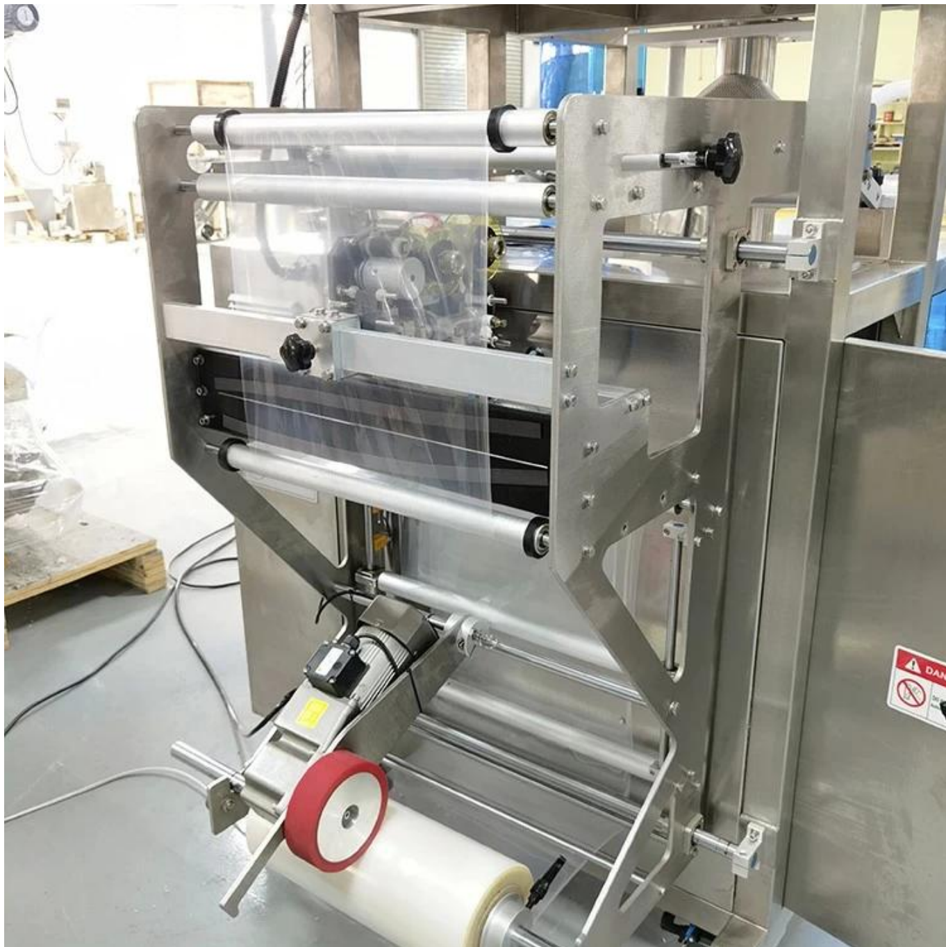
Suporte de filme