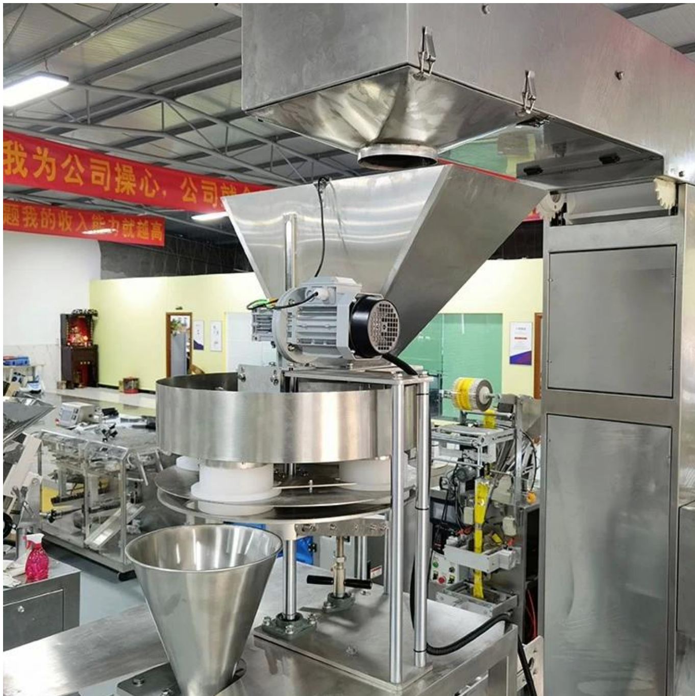
Dispositivo de medição