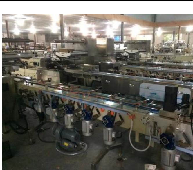
ÁREA LOCAL DA MÁQUINA