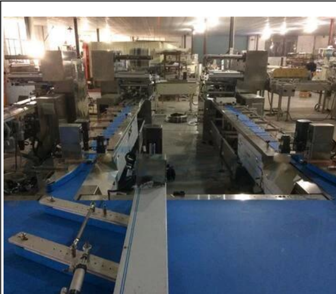
ÁREA LOCAL DA MÁQUINA