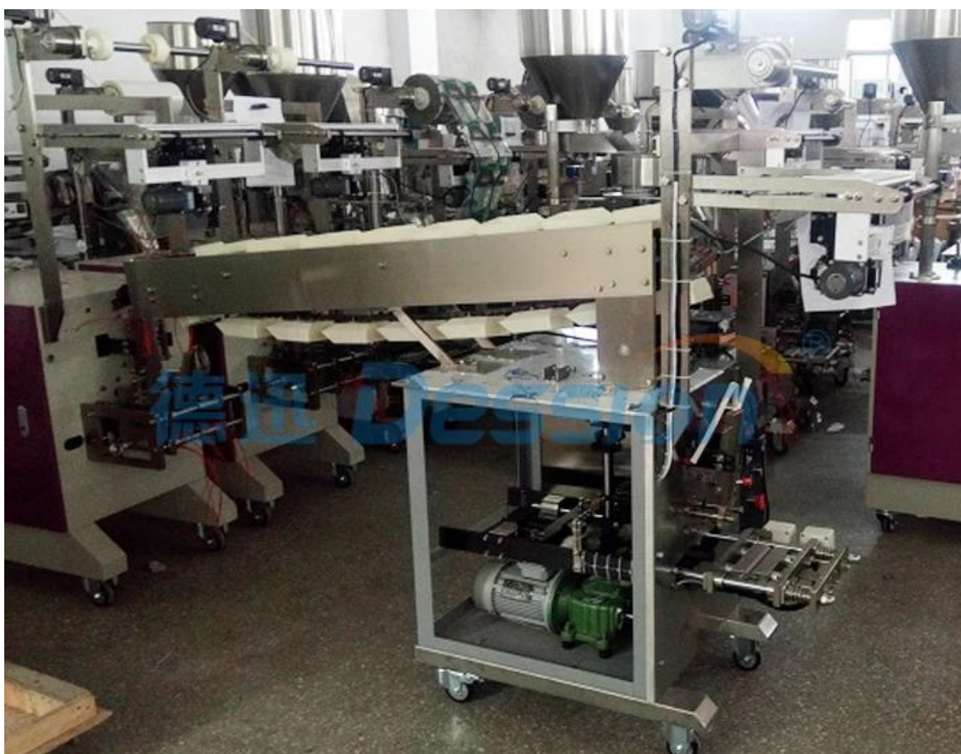
Bolsa automática da máquina de envasadora e vendedora