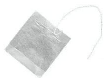
Tea bag with thread