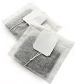
Tea bag with tag and thread