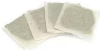
Square/Pillow tea bag